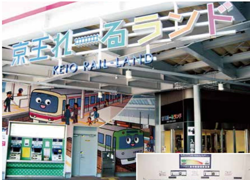
京王れーるランド外観(上) 小型シミュレータでは、京王線(2台)と井の頭線(1台)の運転体験が可能です(右)

〒191-0042 東京都日野市程久保3-36-39 ☎042-593-3526 https://www.keio-rail-land.jp/