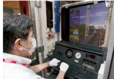
カットモデルの運転席で操作できる運転シミュレータ。上級は現役でも「難しい」とか

通チケットを使うお客さまも多いそうです。コアなお客さまである未就学児から小学校低学年の子ども連れの層は、ハグハグ・動物園とも重なるので、相乗効果でお客さまをつかんでいる様子。