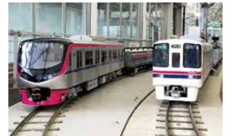
屋外では3種類のミニ電車で外周コースをのんびり回れます