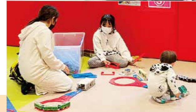
ジオラマの模型車両も、実際に使われた運転台で走らせることができます(上)好きなレイアウトでレールを組み立てられるプラレールで遊ぼう(左)