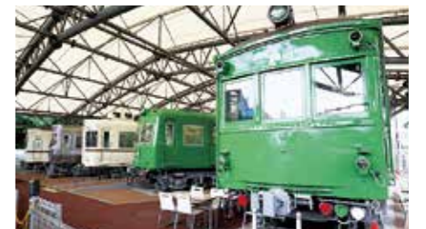
京王電鉄の「レジェンド車両」が並ぶ展示コーナー